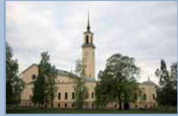
Viinikan kirkko muodostaa tasapainoisen kokonaisuuden, katsoipa sitä miltä suunnalta tahansa.