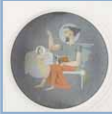
Siivellinen ihminen on evankelista Matteuksen vertauskuva.