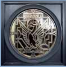
Kirkon ovenssa on evankelista Johannesta symboloiva kotka.